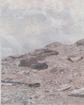
Ein Traum wurde wahr: Andreas Holzer