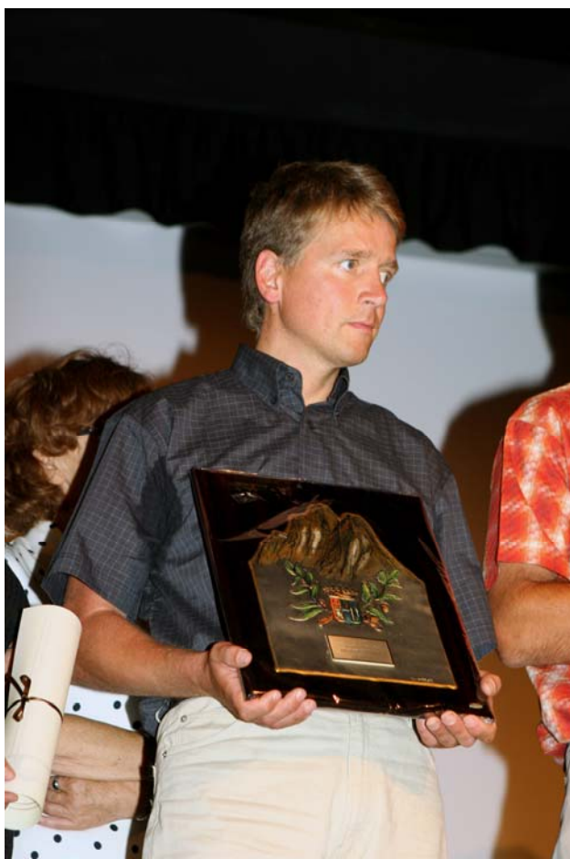
PREMIO "PELMO D'ORO" 2006

Erik Weihenmayer: non vedente dall'età di 13 anni, è riuscito a trasformare l'idea stessa di cecità, mai permettendo che il suo handicap interferisse con la passione per la montagna. Ha portato a termine un'impresa importante: scalare i Seven Summits, le vette più alte dei sette continenti, Everest compreso, ma ha scalato anche nelle Dolomiti Bellunesi.