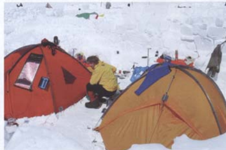
Schneemauern schützen die Zelte vor den extremen Windböen.