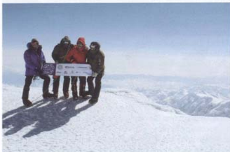
Lohn für die Mühen: Das Team am Gipfel des Mt. McKinley.

Was dann noch folgte, war für alle am Limit. In nur vier Stunden erreichten sie wieder das Highcamp und am nächsten Tag stiegen und fuhren sie die gesamte Strecke bis zum