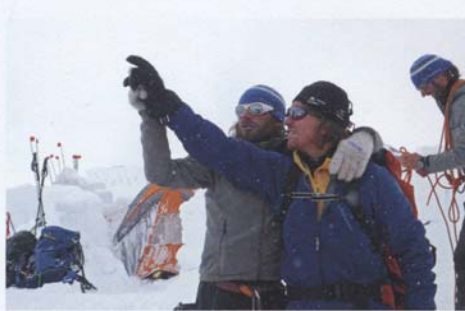
Wegbeschreibung einmal anders.