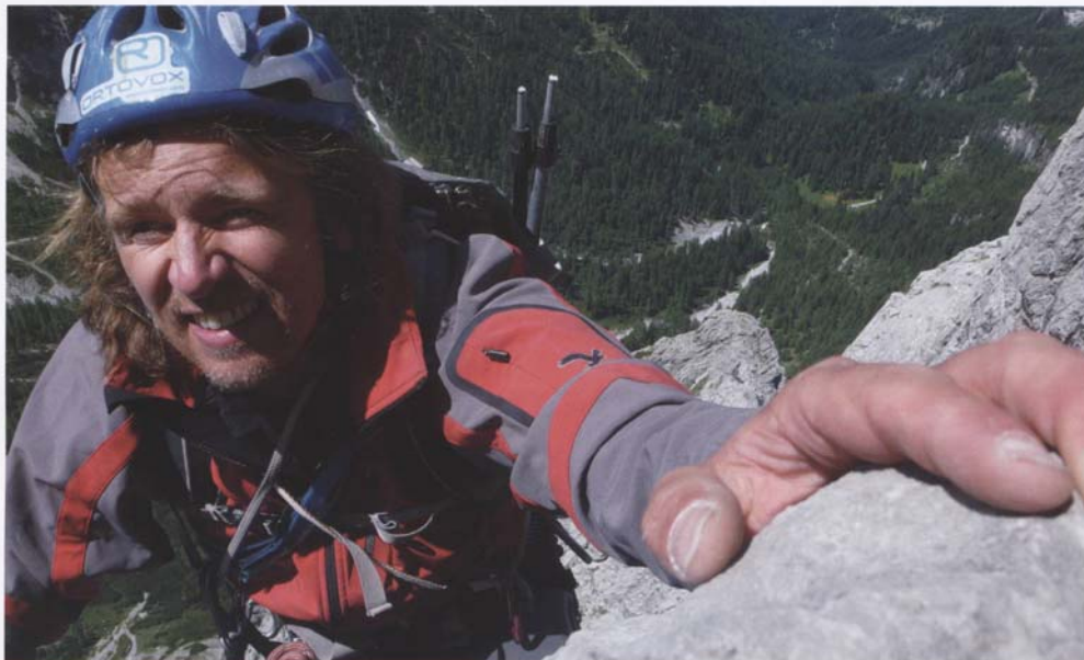
Vom elterlichen Hausdach zu den schwierigsten Berggipfeln